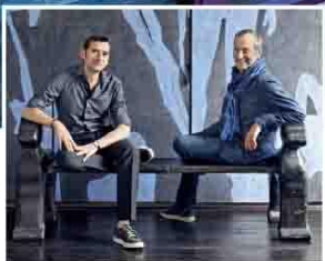
Парижская студия Marc Hertrich & Nikolas Adnet

Глядя на внушительный готический собор Лозанны, «Swiss Wine Hotel & Bar» представляет собой идеальное место для путешествия и покупки белых вин из Лаво. Область может похвастаться одними из самых красивых и умиротворенных пейзажей в Швейцарии. Город Лозанна является главной ее достопримечательностью, посещаемой туристами, что делает его идеальным местом для расположения отеля и позиционирования себя в качестве элитного продавца вин.