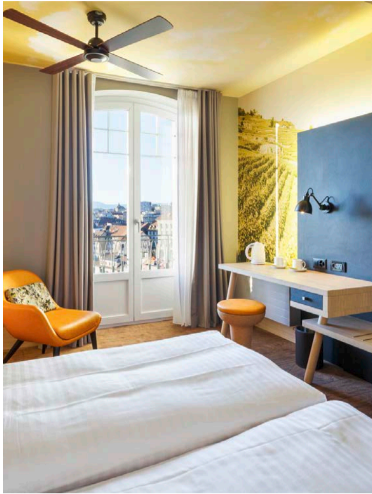
Une chambre du Swiss Wine Hotel & Bar de la chaîne Hotels by Fassbind.