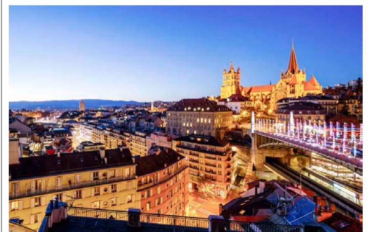
Plusieurs chambres jouissent d'une vue imprenable sur la ville.

D'avantage d'informations: byfassbind.com/fr www.momentsfurniture.com