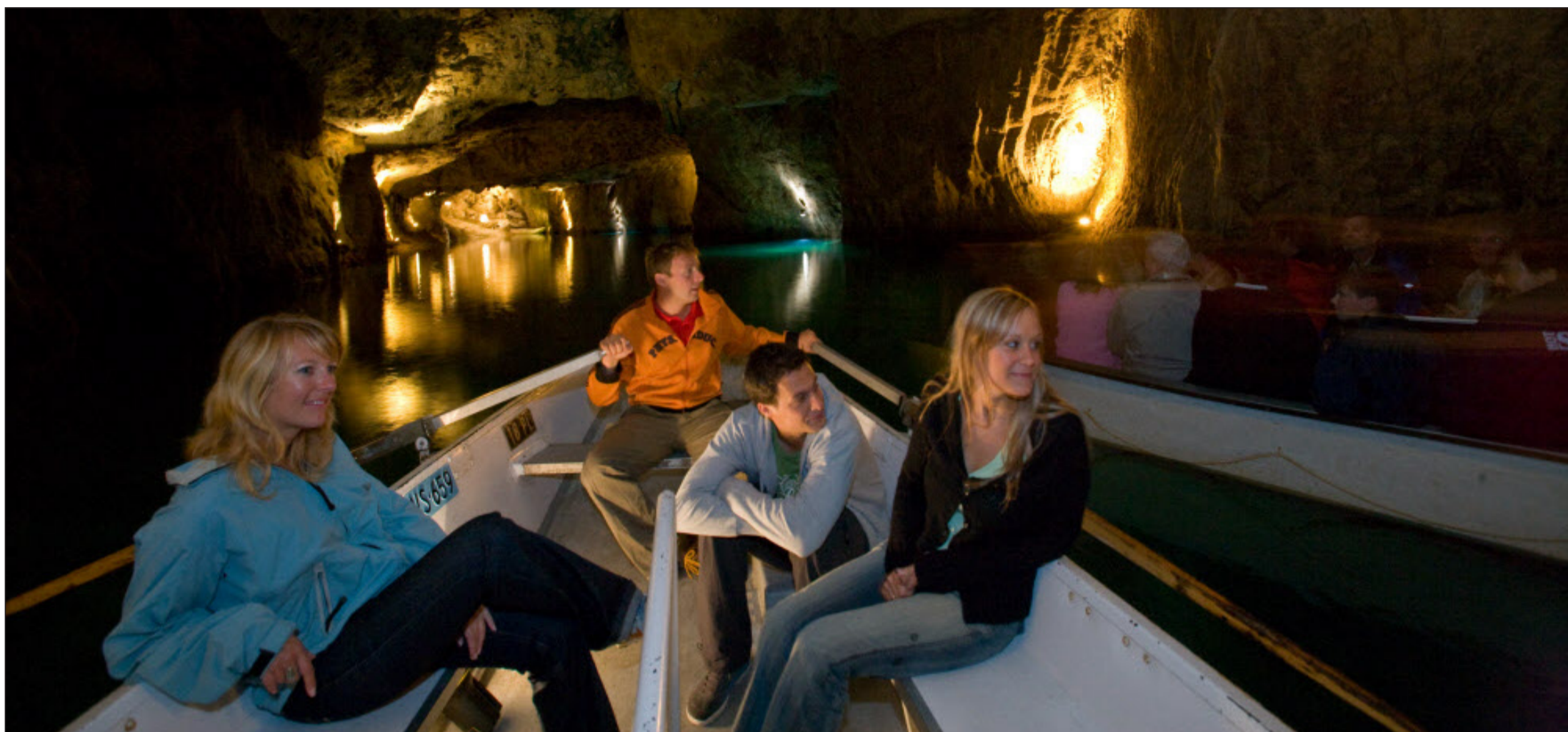
Près de 80 000 personnes visitent chaque année le cadre féerique du lac souterrain de Saint-Léonard, en Valais central.