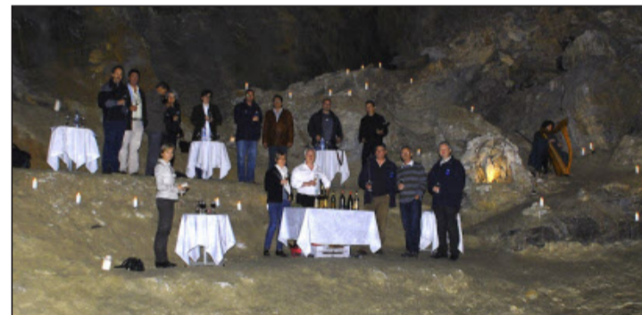
Une soirée de dégustation pour les 60 ans d'exploitation du St-Léonard.