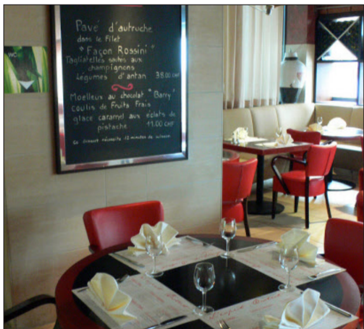
«L'Esprit Bistrot», le nouveau nom de la brasserie.

Etablissement de la famille Fassbind, l'Hôtel Alpha-Palmiers à Lausanne a enrichi son offre. Il compte notamment de nouvelles chambres.